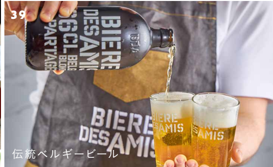
伝統ベルギービール