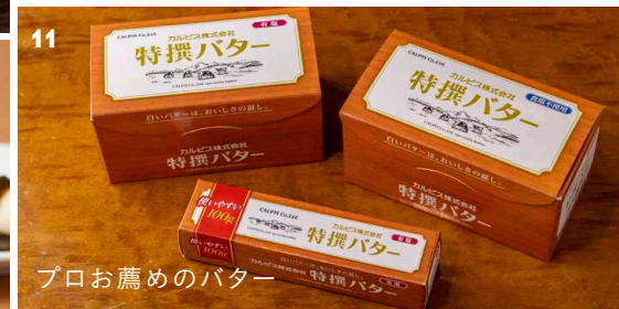
プロお薦めのバター