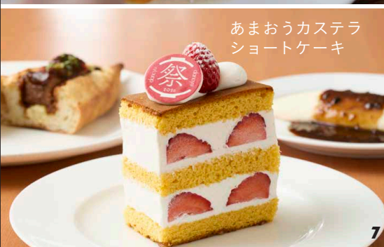
あまおうカステラ ショートケーキ