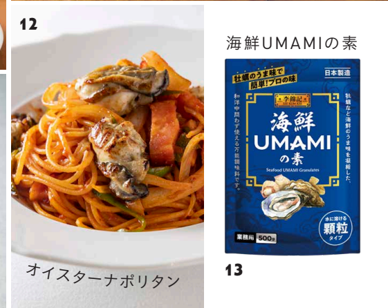
オイスターナポリタン