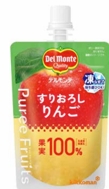
すりおろし フルーツ