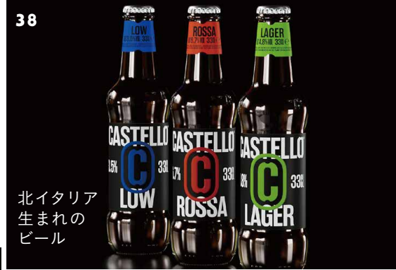
北イタリア 生まれの ビール