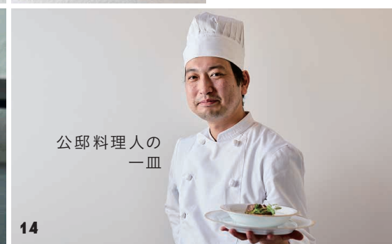
公邸料理人の 一皿