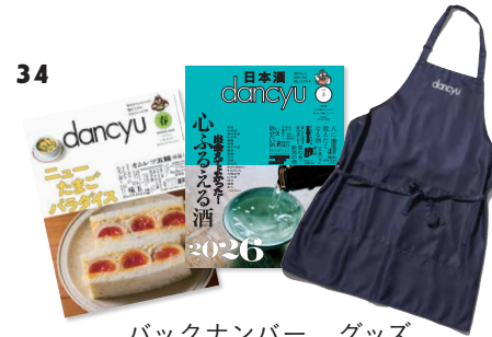
バックナンバー、グッズ