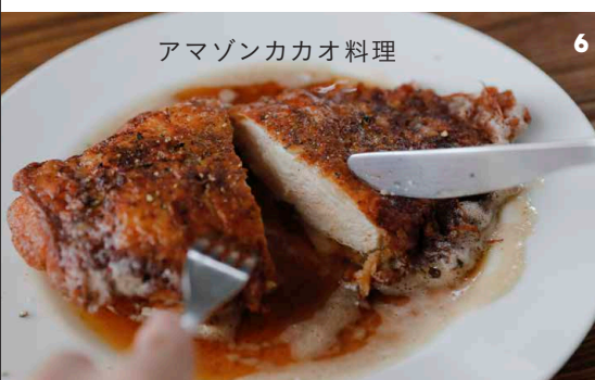
アマゾンカカオ料理