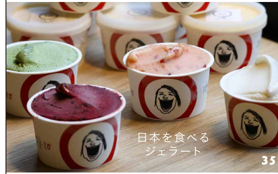
日本を食べる ジェラート