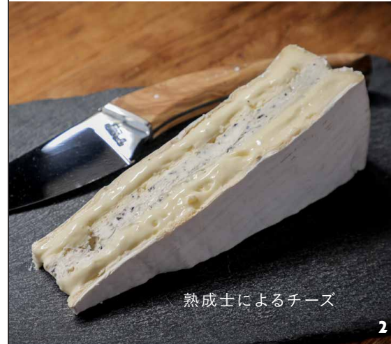
熟成士によるチーズ