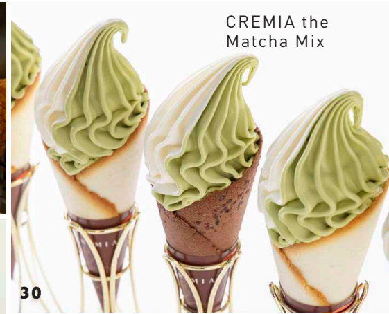
CREMIA the Matcha Mix