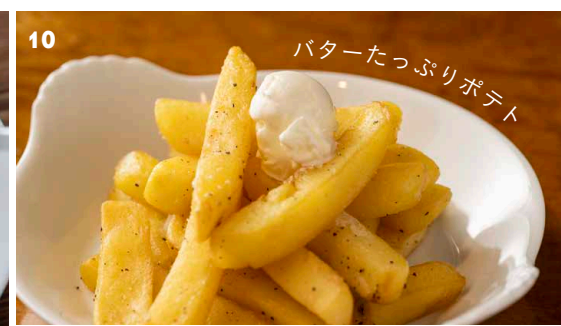
バターたっぷりポテト