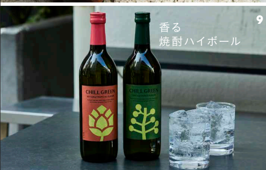
香る 焼酎ハイボール