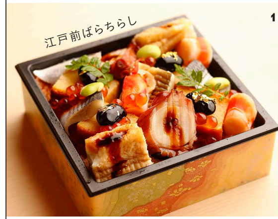
江戸前ばらちらし