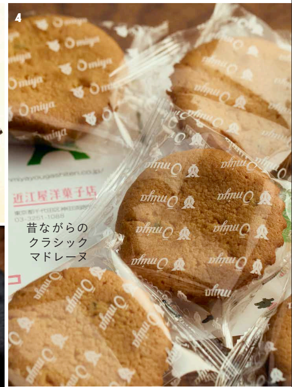
近江屋洋菓子店 昔ながらの クラシック マドレーヌ