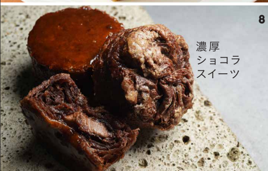
濃厚 ショコラ スイーツ