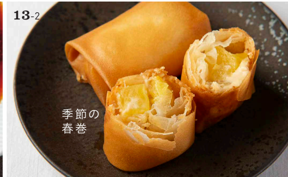
13-2 季節の 春巻