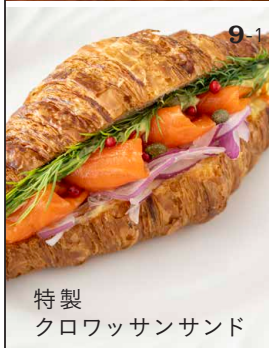
9-1 特製 クロワッサンサンド