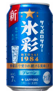
サッポロサワー 氷彩1984