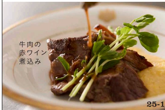
牛肉の 赤ワイン 煮込み