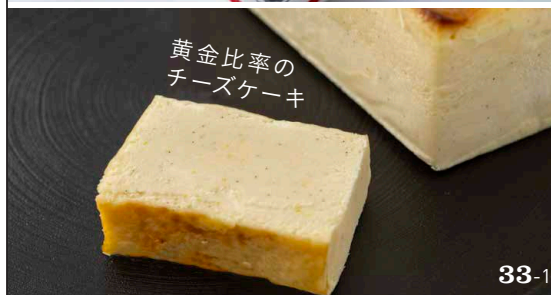
黄金比率の チーズケーキ