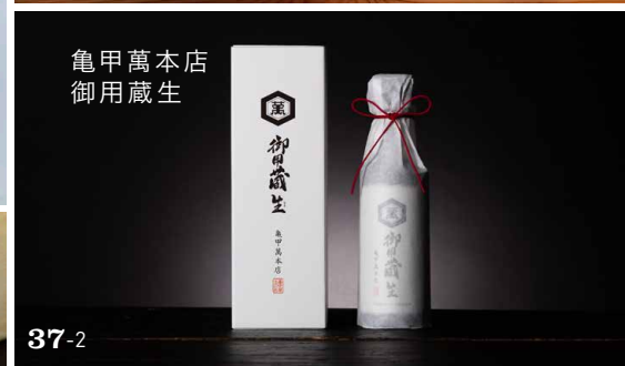
亀甲萬本店 御用蔵生