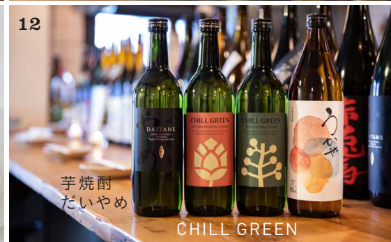
12 芋焼酎 だいやめ CHILL GREEN