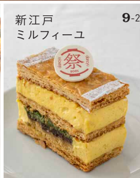
9-2 新江戸 ミルフィーユ