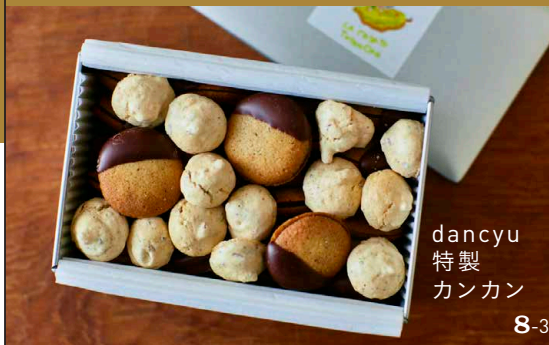
dancyu 特製 カンカン 8-3