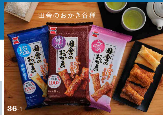
田舎のおかき各種