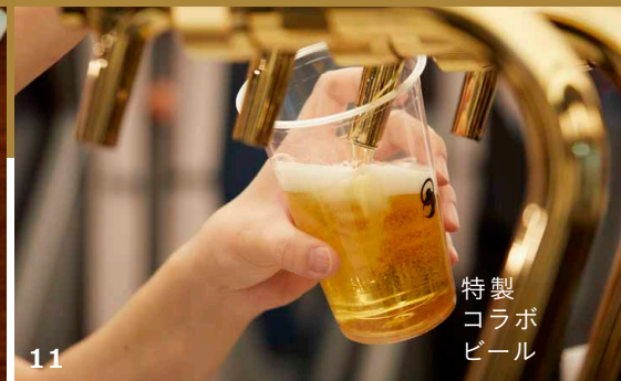
11 特製 コラボ ビール